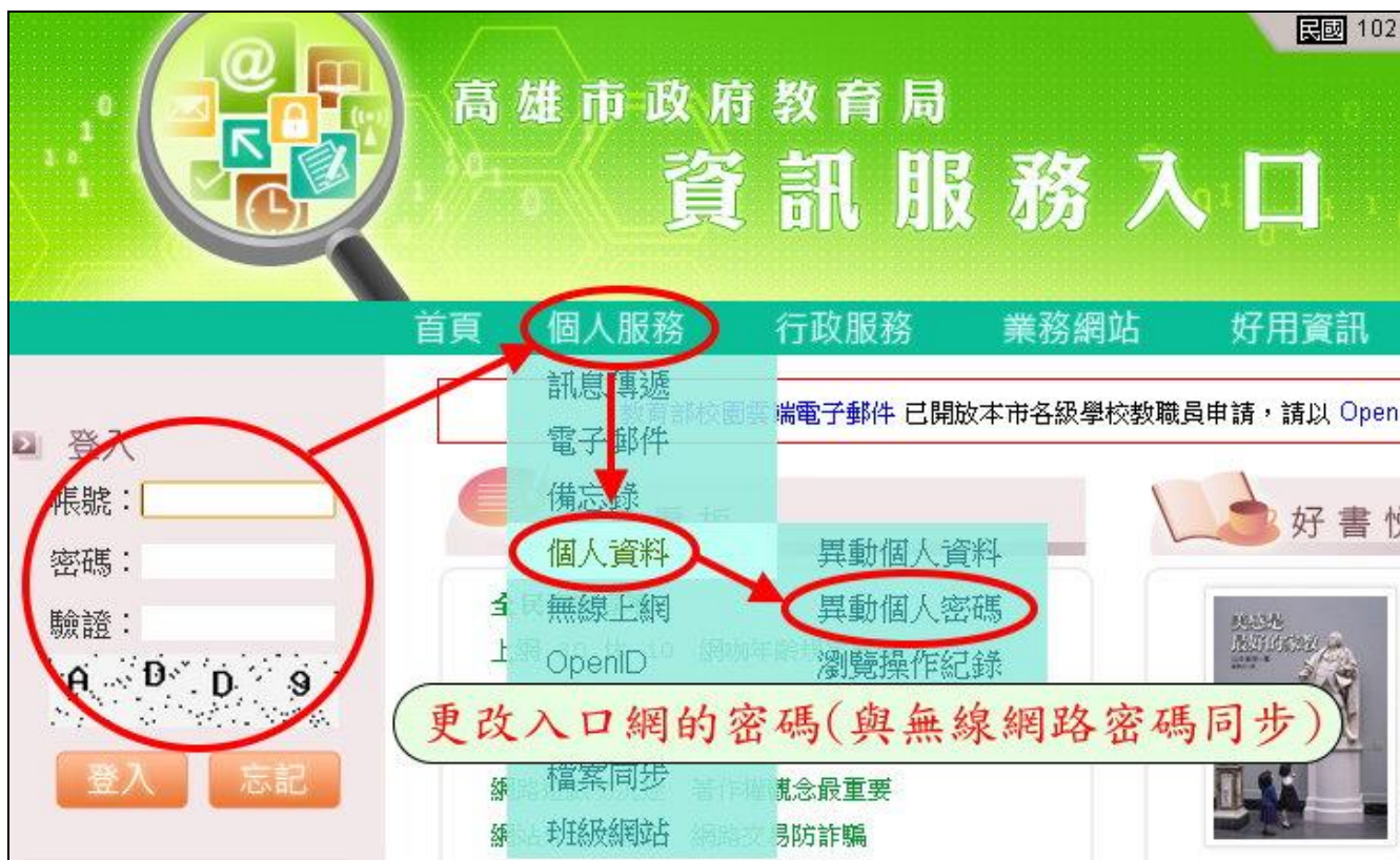
圖 1.更改入口網密碼(包含無線網路)

高雄市教育局的資訊服務入口網提供多項資訊服務：個人教學或班級網站、Dove 電子郵件、知識倉儲、入口網與無線網路密碼同步。更改密碼流程如下圖所示：